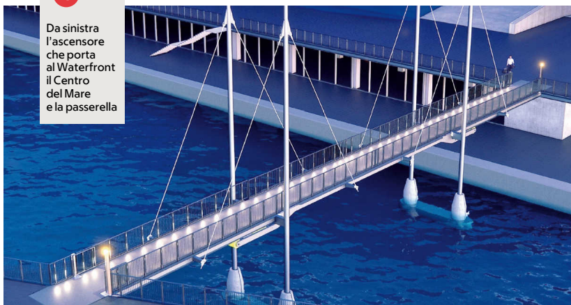
Da sinistra l'ascensore che porta al Waterfront il Centro del Mare e la passerella